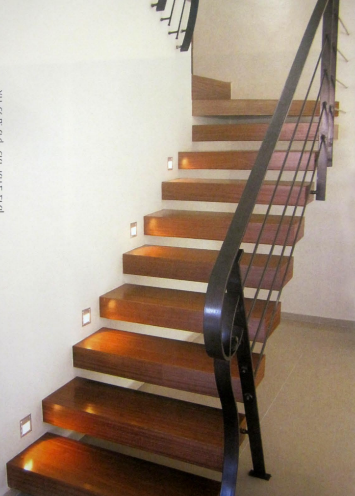
אדריכלים: מיקי כתר ומיכאל ברקן