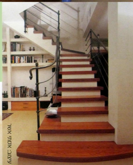
עיצוב: אמיר ארז