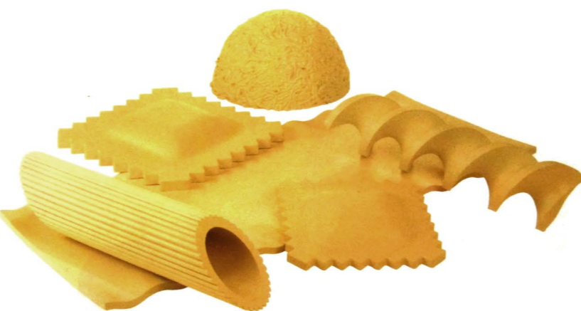
פופים, כריות ומזרונים בצורות אהובות של פסטה, בעיצוב קית משרוני. "חברת הלר"