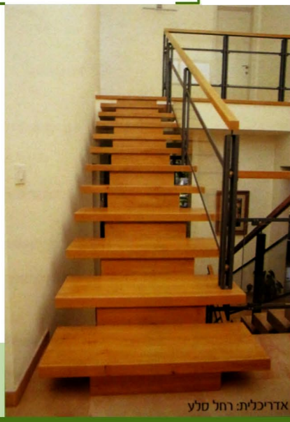
אדריכלית: רחל סלע

בלעדי חיפוי מדרגות בעץ גושני. ניתן לצפות מדרגות קיימות משיש, קרמיקה ומוזאיקה ללא פרוק