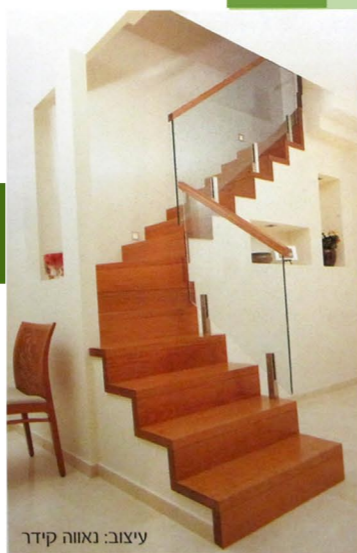
עיצוב: נאוה קידר