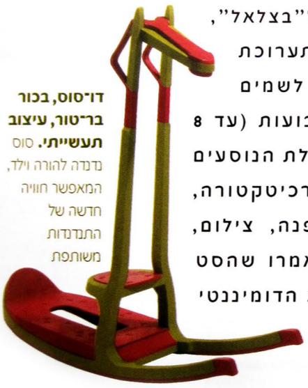
דו־סוס, בכור בר־טור, עיצוב תעשייתי. סוס נדדה להורה וילד, המאפשר חוויה חדשה של התנדדות משותפת

"עת השתחררתי הרופאים המליצו לי ביקור חודשי בממל התעופה. זה עושה לי טוב לראות מטוס ממריא דרך דמעה שקופה" שר יפה מאיר