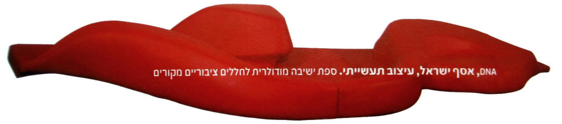
DNA, אסף ישראל, עיצוב תעשייתי. ספת ישיבה מודולרית לחללים ציבוריים מקורים

כמודגמים, יעל דבי, עיצוב תעשייתי. מוצרים צפים המעודדים פעילות גופנית במים באמצעות משחק