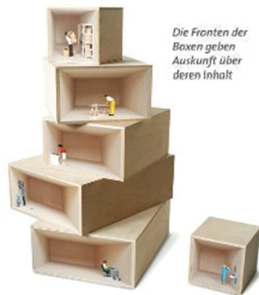
Die Fronten der Boxen geben Auskunft über deren Inhalt