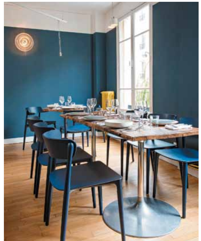
IMAGEN: CORTESÍA ÉMILIE BONAVENTURE

París tiene nuevo hotspot gourmet: el restaurante de comida marina Belle Maison, cuyo interior diseñó Émilie Bonaventure. La idea de este lugar es generar un ambiente acogedor y relajado para que los comensales se sientan como en casa. Bonaventure reafirmó su gusto por lo artesanal en este trabajo, pues la decoración se distingue por el uso de materiales orgánicos con toques refinados y sutiles.